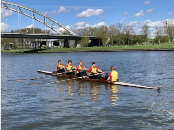
Sylvester op Amsterdam-Rijnkanaal

De oudste boot waarin Het Galjoen vaart, kent een unieke ontstaansgeschiedenis. Na een domme ramp werd de boot niet door de Breukelse roeivereniging gekocht maar gekregen. Het was indertijd de snelste boot die ooit door een vermaarde Utrechtse botenbouwer is vervaardigd. Hij is geschonken door een fanatiek sportende mecenas die het zich kon veroorloven om enorm veel geld te besteden aan allerlei sportaccommodaties en sporters.