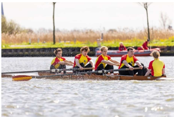
Sylvester op Varsity 2024

Godezijdank is dus de Sylvester het lot bespaard gebleven om - in stukken gezaagd - als boekenkastjes te eindigen. Dankzij zorgvuldige reparaties en onderhoud is de Sylvester al 64 jaar in de vaart gebleven. Dit jaar is in die historische boot de zogenoemde Varsity geroeid. Dat is een traditionele studentenroeiwedstrijd die sinds 1878 jaarlijks wordt gehouden. Eén van de onderdelen is een wedstrijd in historische overnaadse boten. Een studenten-roeiploeg van Het Galjoen streed daar mee: uiteraard in de Sylvester.