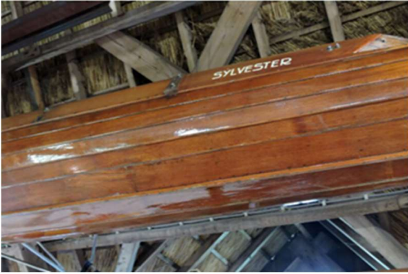
Romp van de overnaadse Sylvester.

Die man bouwde indertijd de snelste overnaadse boten. Overnaads duidt op de bouwwijze waarbij de romp van de boot bestaat uit elkaar overlappende planken.