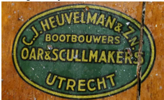
Firmanaam zoals die staat in de Sylvester